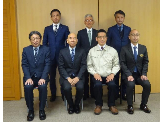
特別表彰受賞者の記念撮影