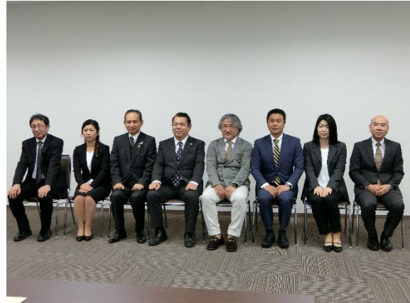
特別表彰受賞者の記念撮影